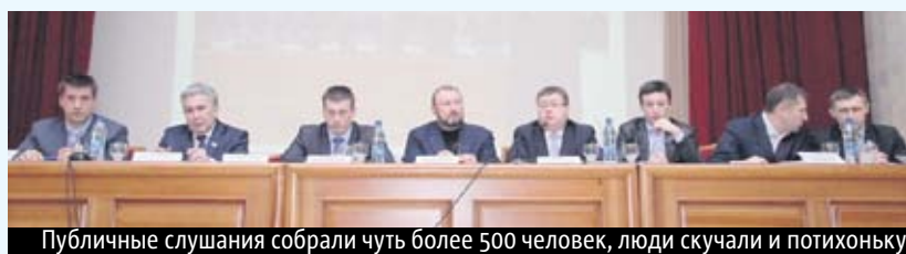
Публичные слушания собрали чуть более 500 человек, люди скучали и потихоньку расходились

род потихоньку начал покидать зал. Остальные граждане, прямо как в песне Высоцкого, стали мирно засыпать, ожидая окончания. Вот если бы, например, ансамбль «Золотое кольцо» разбавил мероприятие — тогда другое дело.