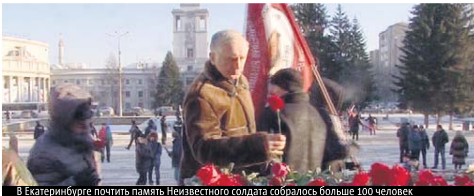
В Екатеринбурге почтить память Неизвестного солдата собралось больше 100 человек