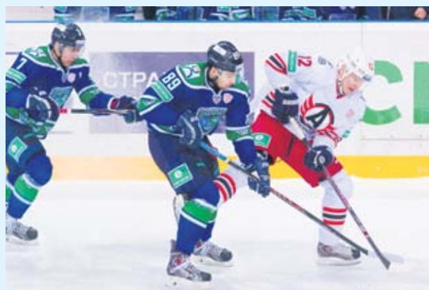
«Автомобилист» вернулся из Ханты-Мансийска без победы и без здоровья

«В Екатеринбург мы отправили пять игроков,