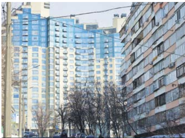
Ипотека подорожала, и возможностей приобрести квартиру за счёт ипотечных денежных средств стало меньше