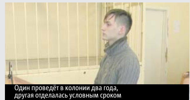
Один проведёт в колонии два года, другая отделалась условным сроком