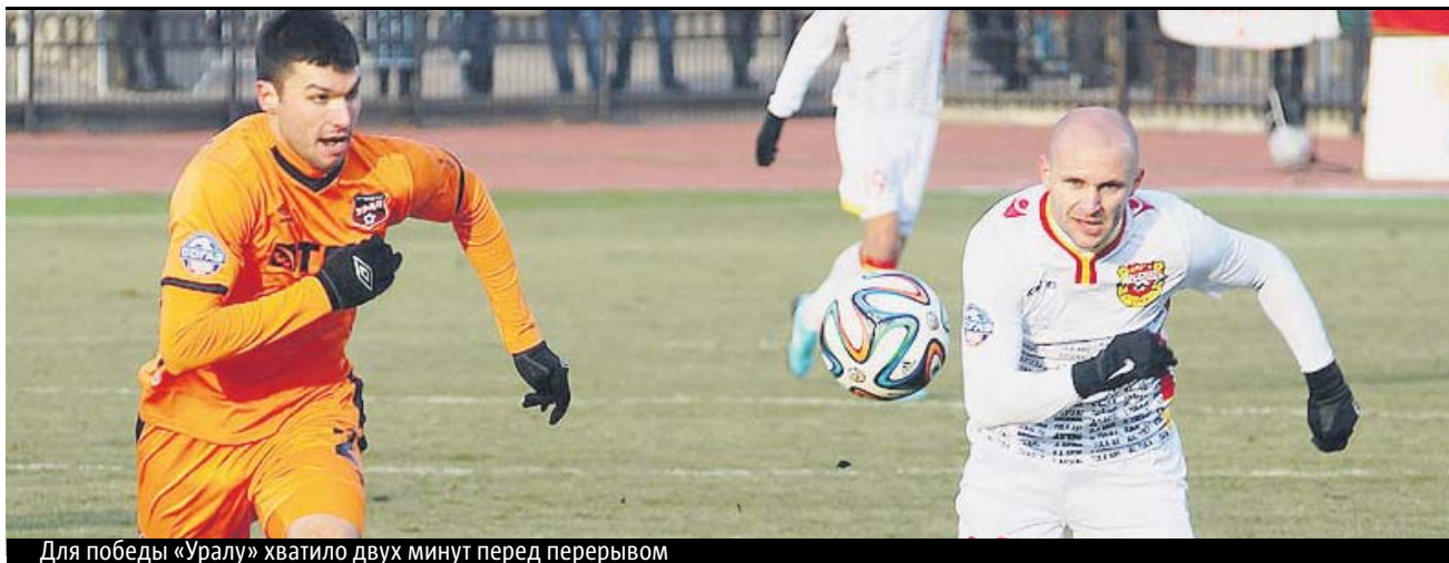
Для победы «Уралу» хватило двух минут перед перерывом

15-й тур чемпионата России по футболу свёл в очной встрече тульский «Арсенал» и «Урал». Напомним, первый матч этих команд прошёл в екатеринбургском манеже и завершился победой «шмелей» — 1:0. Удалось победить и на выезде — 1:2. Подробности — в колонке Максима Садыкова