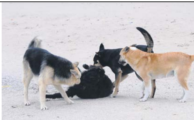
Если вам на пути попала стая бродячих собак, перейдите на другую сторону улицы; не пытайтесь прикормить животных или поиграть с ними

— К нам ежедневно поступает по пять-шесть заявок от населения на отлов