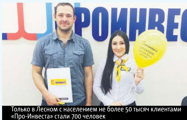
Только в Лесном с населением не более 50 тысяч клиентами «Про-Инвеста» стали 700 человек

Своих клиентов создатели пирамид ловят на ценнейшем для них человеческом качестве — любви к халяве. Первые пирамиды появились ещё в XVIII веке, на 1990-е годы в России пришёлся расцвет мошеннических структур: миллионы обманных, триллионы потерянных рублей. Русский народ с удивительным упорством продолжает наступать на те же грабли.