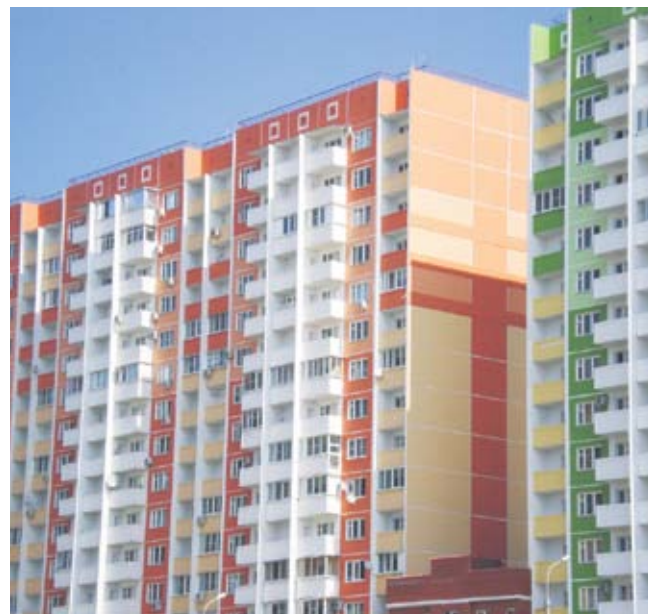
Если у вас есть нужда продать и приобрести жильё, это нужно сделать вне зависимости от того, кризисная у нас ситуация или нет

много ниже, чем в центральных районах. При этом за счёт новостроек жильё там стало более комфортным, несмотря на своё расположение, потому и пользуется соответствующим спросом.