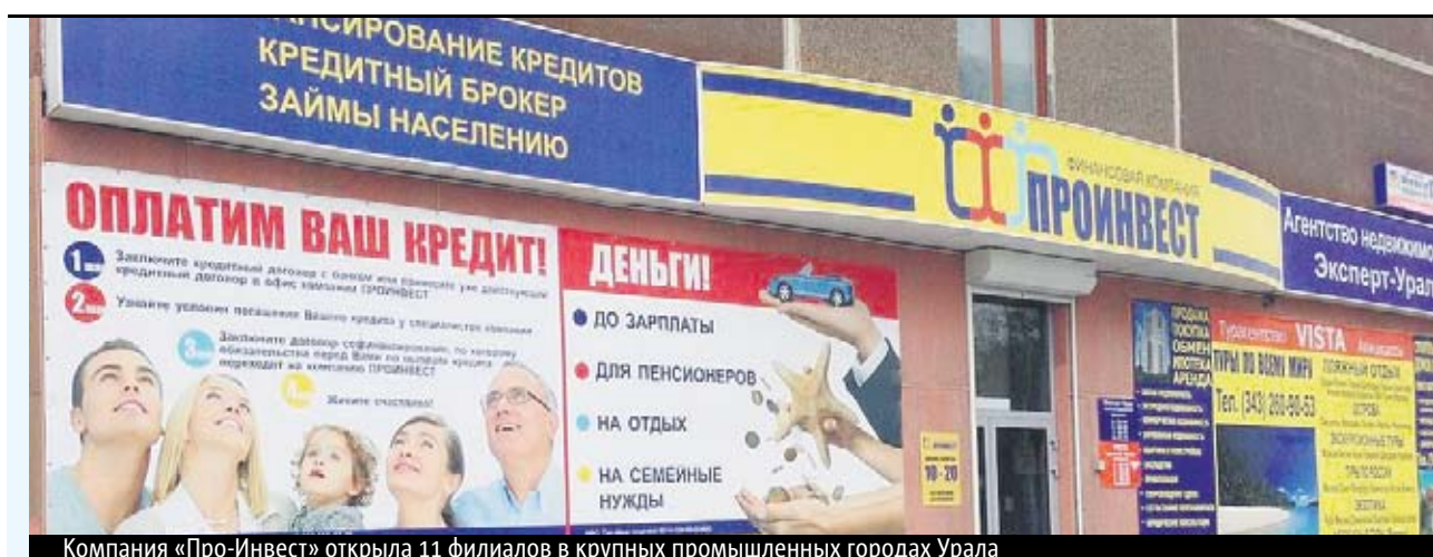
Компания «Про-Инвест» открыла 11 филиалов в крупных промышленных городах Урала

Сотни жертв финансовой пирамиды «Про-Инвест» пишут заявления в полицию