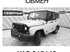
УАЗ 315148 2008 г. ДИЗЕЛЬ, ГУР, аудиоподготовка, новая резина. Цена: 260 т.р.