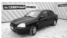
Kia Rio 2004 г. АВТОМАТ ГУР, ЭСП, ПБ, литые диски. Цена: 215 т.р.