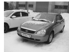
ЛАДА ПРИОРА 2011 г.в. 2 ЭСП, ГУР, МР-3, ЦЗ ЭЗ, 1 ПБ, БК, иммобилайзер, сигнализация с АЗ. Торг! Обмен! Кредит! Цена: 205 т.р. 8-922-22-79-595