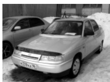
ВАЗ 21104 2005 г.в. Один хозяин, клапана не гнет, сигнализация, музыка, 2 ЭСП, бортовой компьютер. Торг! Обмен! Кредит! Цена: 119 т.р. 8-922-22-79-595