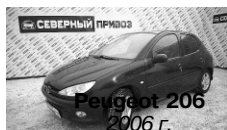
Peugeot 206 2006 г. АВТОМАТ, 1 хозяин, ГУР, панорамная крыша, музыка, климат-контроль, зима-лето. Цена: 225 т.р. ОБМЕН