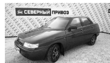
VAZ-2110 2001 г. идеальное сост. ИНЖЕКТОР, зимняя резина, чехлы, музыка, ЭСП, сигнализация. Цена: 99 т.р. ОБМЕН