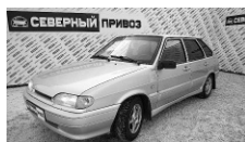
VAZ-2114 2005 г. аудиоподготовка, литые диски, сигнализация с АЗ, ЭСП. Цена: 130 т.р.