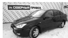
Ford Focus 2005 г. ГУР, ЭСП, ПБ, кондиционер, сигнализация с АЗ, отличное тех.сост. Цена: 225 т.р.