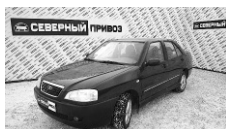
Chery Amulet 2008 г. 1 хозяин, ПБ, ЭСП, музыка, колонки, антикор, кондиционер, литые диски. Цена: 170 т.р.