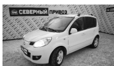
Great Wall Peri 2009 г. ГУР, ЦЗ, ЭСП, кондиционер, зимняя резина, литые диски. Цена: 190 т.р.