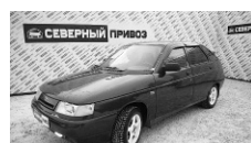
VAZ-2112 2006 г. ЭСП, борт.компьютер, музыка, колонки, литые диски. Цена: 150 т.р.

КРУПНЕЙШИЙ АВТОРЫНОК ГОРОДА «СЕВЕРНЫЙ ПРИВОЗ»: 8-950-555-55-20