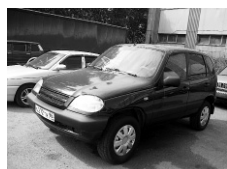
НИВА ШЕВРОЛЕ ЛЮКС 2008 г.в., проклеен, ГУР, сигнализация, ЦЗ, 2 ЭСП, ЭЗ с подогревом, МР-3, резина зима-лето. Обмен! Кредит! Цена: 255 т.р. 8-922-22-79-595