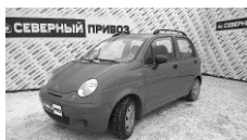
Dewoo Matiz 2008 г. 1 хозяин, родной ПТС, ПБ, ЭСП, ГУР, колонки, литые диски, кондиционер. Цена 140 т.р.