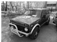
НИВА 21310 2007 г.в., подогрев двигателя 220 V, сигнализация, музыка, резина всесезонная, тюнинг, один хозяин. Торг! Обмен! Кредит! Цена: 155 т.р. 8-922-22-79-595