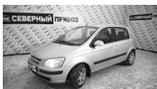
Hyundai Getz 2004 г. ГУР, кондиционер, ЭСП, мех блокировка, зима-лето, лит диски, корейская сборка. Цена: 225 т.р.

г. Краснотурьинск, ул. Октябрьская, 13 а (напротив полиции), т. 8-950-55555-20