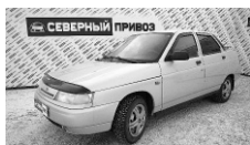
VAZ-2110 2005 г. сигн. с АЗ, ЭСП, аудиоподготовка, зимняя резина. Цена: 115 т.р.