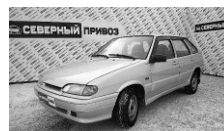
VAZ-21140 2005 г. родной ПТС, ЭСП, ЦЗ, антикор, музыка, колонки, ковры салона. Цена: 110 т.р.