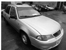
ДАУ НЕКСИЯ 2011 г.в. USB, МР-3 Торг! Обмен! Кредит! Цена: 160 т.р. 8-922-22-79-595