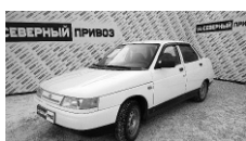
VAZ-2110 2000 г. сигнализация, аудиоподготовка, новая зимняя резина, летняя резина на литых дисках. Цена 70 т.р.