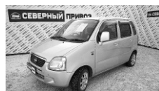
Suzuki R Solio 2001 г. АВТОМАТ, ЭСП, ГУР, кондиционер, резина зима-лето на литых дисках. Цена: 155 т.р.