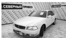
Nissan Leopard 1998 г. ГУР, ЦЗ, музыка DVD, колонки, ЭСП, камера заднего вида, ABS, литые диски. Цена: 265 т.р.