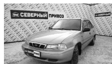
Dewoo Nexia 2006 г. ГУР, кондиционер, 4ЭСП, музыка, ЦЗ, колонки, чехлы, зимняя резина. Цена: 139 т.р.