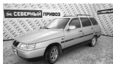
VAZ-2111 2001 г. ЭСП, сигнализация, хорошее тех. сост. Цена: 100 т.р.