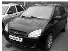
ХЕНДАЙ ГЕТЦ 2007 г.в. МКПП, ГУР, ПБ, ЦЗ, МР-3, сигнализация с АЗ. Торг! Обмен! Кредит! Цена: 225 т.р. 8-922-22-79-595