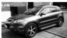
SsangYong Actyon 2008 г. 1 хозяин, родной ПТС, 4WD, музыка, колонки, ЦЗ. Цена: 410 т.р.