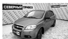
Chevrolet Aveo 2007 г. ГУР, ЭСП, ПБ, сигнализация с АЗ, литые диски, зимняя резина, кондиционер. Цена: 245т.р. ОБМЕН