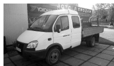
GAZ-3302 2011 г. 1 хозяин, климат-контроль, новый тент, новая резина. Цена 410 т.р.