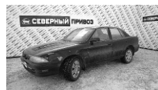
Toyota Camry 1991 г. ГУР, ЭСП, ПБ, кондиционер, сигнализация. Цена: 50 т.р.