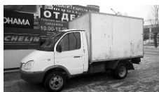
GAZель 3302 2003 г. термобудка, ГАЗ+бензин, хорошее тех. состояние. Цена: 170 т.р.