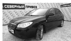
Hyundai Elantra 2009 г. ГУР, ПБ, зима-лето, сигн. с АЗ, 4 ЭСП, аудиосистема. Цена: 375 т.р.