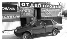
VAZ-21099 2001 г. ИНЖЕКТОР, европанель, чехлы, музыка, родной ПТС. Цена: 65 т.р. ОБМЕН