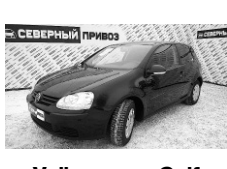
Volkswagen Golf 2008 г. АВТОМАТ ЭСП, ГУР, новая зимняя резина, климат-контроль. Цена 360 т.р.