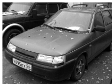
ВАЗ 21112 2007 г.в. 2 ЭСП, сигнализация с АЗ, европанель, МР-3, ЦЗ. Торг! Обмен! Кредит! Цена: 129 т.р. 8-922-22-79-595