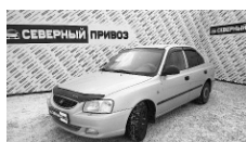
Hyundai Accent 2005 г. АВТОМАТ, ГУР, кондиционер, ПБ, сигнализация с АЗ. Цена: 250 т.р.