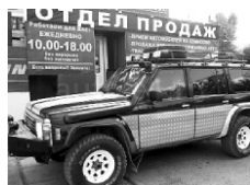
Nissan Patrol 1992 г. ПБ, ЭСП, эл.зеркала, антикор, кондиционер, багажник на крыше. Цена: 660 т.р.