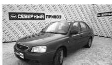
Hyundai Accent 2005 г. АВТОМАТ, ГУР, кондиционер, ПБ, сигнализация с АЗ. Цена: 240 т.р.