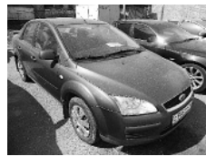
ФОРД ФОКУС 2 2006 г.в., двигатель 1600, ГУР, ПБ, ЦЗ, ПБ, кондиционер, CD, 2 ЭСП, иммобилайзер. Торг! Обмен! Кредит! Цена: 259 т.р. 8-922-22-79-595