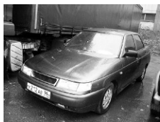
ВАЗ 21101 2006 г.в., 4 ЭСП, МР-3, сигнализация, европанель. Торг! Обмен! Кредит! Цена: 119 т.р. 8-922-22-79-595