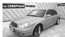
Hyundai Sonata 2008 г. ГУР, кондиционер, сигнализация, литые диски, резина зима-лето. Цена: 370 т.р.