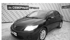
Toyota Corolla 2010 г. АВТОМАТ ЭСП, ГУР, климат-контроль, аудиоподготовка, резина зима+лето. Цена: 599 т.р.