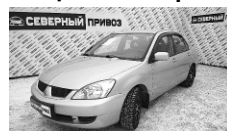
Mitsubishi Lancer 2007 г. 1хозяин, ГУР, 4ЭСП, новая зимняя резина, ПБ, идеальн. сост. Цена: 295 т.р.