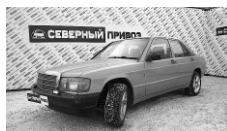
Mercedes-Benz E-Class 1986 г. ЭСП, ЦЗ, сигнализация, музыка, колонки, литые диски. Цена: 90 т.р.