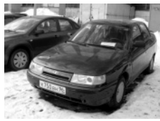
ВАЗ 21102 2004 г.в., 2 хозяина, ПТС родной, 4 ЭСП, ПС, ЦЗ, сигнализация, АМ. Торг! Обмен! Кредит! Цена: 88 т.р. 8-922-22-79-595