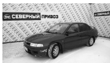
Mitsubishi Lancer 2001 г. АВТОМАТ ГУР, ЭСП, климат-контроль, сигнализация. Цена: 140 т.р.