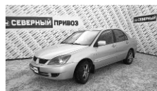
Mitsubishi Lancer 2005 г. ГУР, ЭСП, ПБ, сигнализация, литые диски, зимняя резина. Цена: 230 т.р.