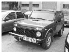
НИВА 2002 г.в. Торг! Обмен! Кредит! Цена: 155 т.р. 8-922-22-79-595