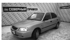
Hyundai Accent 2008 г. ГУР, ЭСП, ПБ, зимняя резина, аудиоподготовка. Цена: 215 т.р.