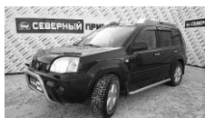
Nissan X-trail 2005 г. 4x4, ABS, ГУР, ПБ, 4ЭСП, ЦЗ, эл.люк, рейлинги, кондиционер. Цена: 470 т.р.