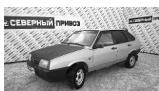
VAZ-2109 2002 г. родной ПТС, антикор, сигнализация, музыка, колонки, ковры салона. Цена: 65 т.р.