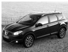
НИССАН КАШКАЙ 2008 г.в., черный цвет, кожа, 4х4, АКПП, ксенон, зима-лето, ПС, БК, 4 ЭСП. Торг! Обмен! Цена: 585 т.р. 8-922-22-79-595