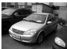
ЛИФАН БРИЗ 2010 г.в., МКПП, 4 ЭСП, ЭЗ, 2 ПС, ПБ, МР-3, БК, ЦЗ, кондиционер, сигнализация. Торг! Обмен! Кредит! Цена: 148 т.р. 8-922-22-79-595

АВТОЦЕНТР "НАРОДНЫЙ" Срочный выкуп автомобилей Обмен, продажа автомобилей Оформление кредитов Договор купли-продажи Автострахование Тел.: 8-9-2222-7-95-95