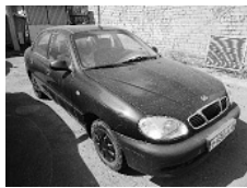
ЗАЗ-ШАНС 2009 г.в., МР-3, сигнализация, резина зима-лето. Торг! Обмен! Кредит! Цена: 115 т.р. 8-922-22-79-595