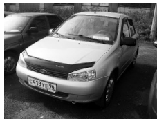
ЛАДА КАЛИНА 2012 г.в., МР-3, иммобилайзер, ЭУР. Торг! Обмен! Цена: 185 т.р. 8-922-22-79-595